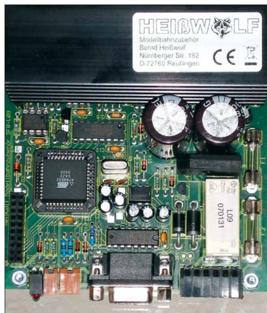
◀ Leistungs- platine von Heißwolf