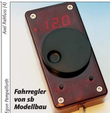
Fahrregler von sb Modellbau